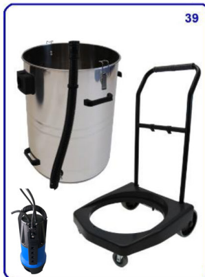
Behälter / Fahrgestell Anbauteile Container / chassis attachments